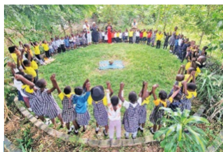
Morgenkreis in der Vorschule von Dangwe