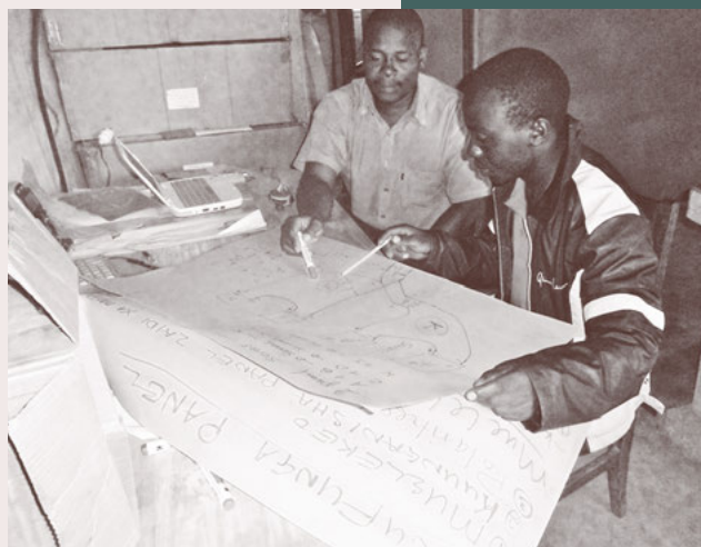
Beratungsgespräch für einen tansanischen Jugendlichen.

Die Rechnung 2014 schliesst (vor Finanzerfolg und Fondsveränderung) mit einem Verlust von CHF 12 891.13 (2013: Verlust von CHF 13 084.61). Der direkte Projektaufwand ist 2014 gegenüber dem Vorjahr um mehr als 50 000 Franken gestiegen. 2014 wurde fepa mit Legaten in ausserordentlichem Umfang bedacht: 140 000 CHF flossen so in unsere Projekte (2013: 10 000).