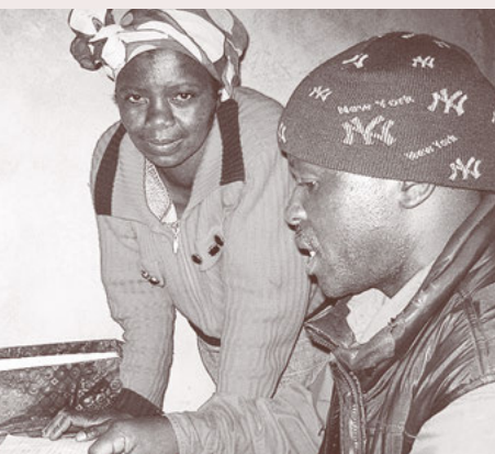
Buchhaltung fürs Solarlampengeschäft.