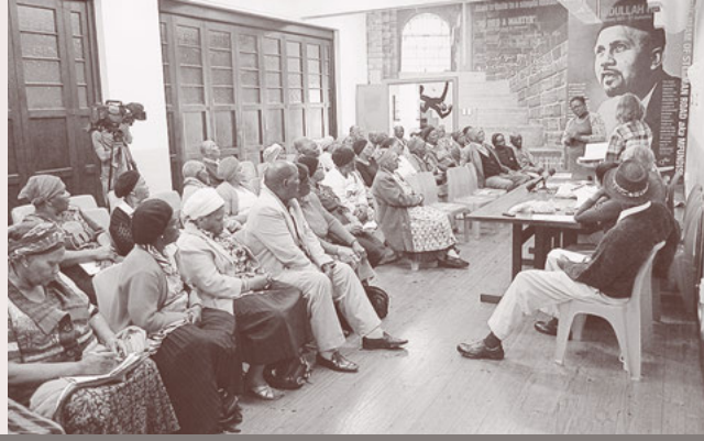
Khulumani Mitglieder bei einer Versammlung in Kapstadt.

erfüllt das Zentrum eine wichtige Funktion, indem es vorher isolierten Jugendlichen eine Möglichkeit zur fachlichen und persönlichen Entwicklung bietet.