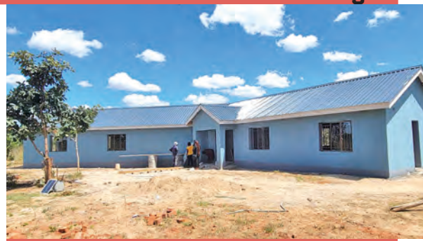
Das fast fertiggestellte «Connect and Learning Centre» auf dem Gelände des «Smart Girls Nest» in Seke, Simbabwe.

Reservieren Sie sich bitte folgende Daten: